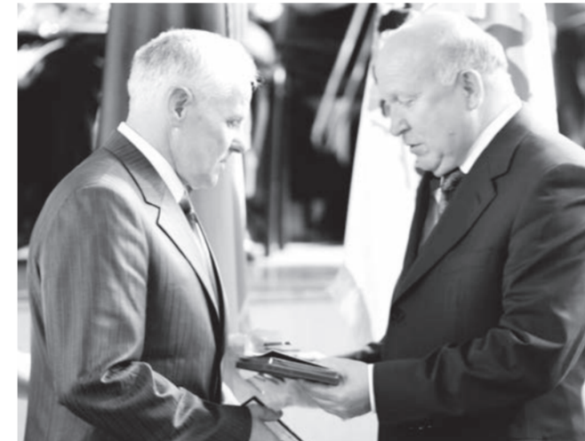
● Награда из рук губернатора