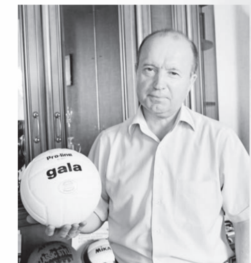
● Этим мячом играл на международных соревнованиях в «Лазурном»